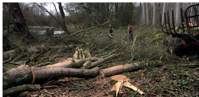
TRAVAUX DE RESTAURATION DE LA FRAYÈRE - MAROLLES-SUR-SEINE (SEME)

SEME accompagne les communes de Grandpuits-Bailly-Carrois, Beauchery-Saint-Martin et de Gironville,