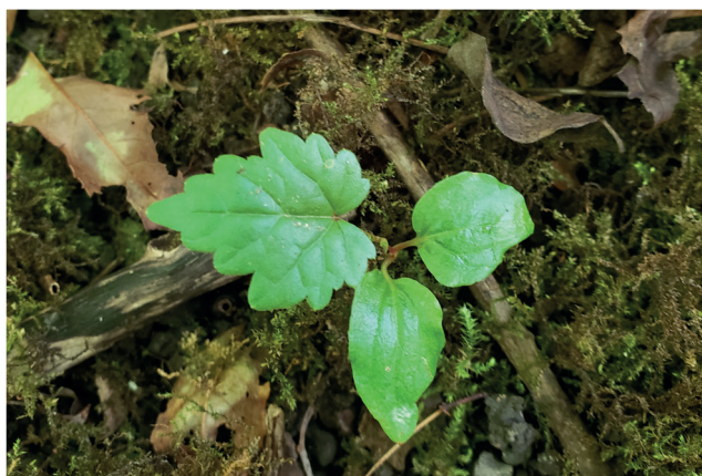
PLANTULE DE VIGNE SAUVAGE (SEME)