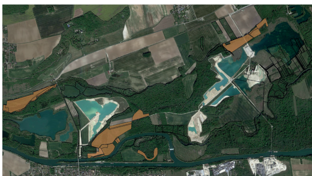
TRAVAUX CEMEX - MAROLLES-SUR-SEINE (SEME)

SEME a également mis à jour le plan de gestion.