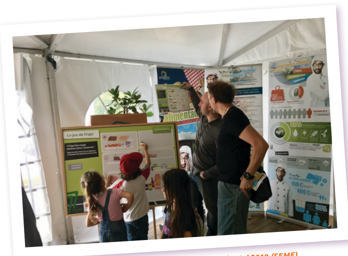
Journée "Environnement et partage" SMITOM-Nord - Mai 2019 (SEME)

14 INTERVENTIONS, ATELIERS, STANDS OU CONFÉRENCES GRAND PUBLIC POUR PRÈS DE 646 PERSONNES SENSIBILISÉES DONT 81 ÉLUS OU AGENTS TECHNIQUES DES COLLECTIVITÉS