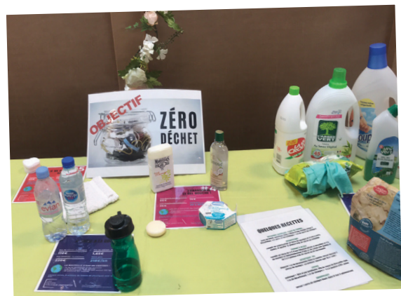
Animation "0 déchet et économies" - Juin 2019 (SEME)