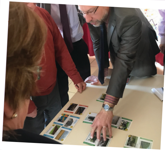
Animation séminaire élus PCAET - Avril 2019 (SEME)

Adaptation de ces séminaires pour mobiliser les acteurs du territoire et développement de nouveaux outils d'appropriation.