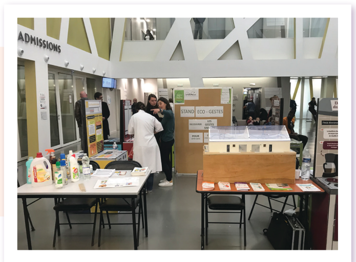
Animation qualité de l'air intérieur - Hôpital de Melun - Mai 2019 (SEME)