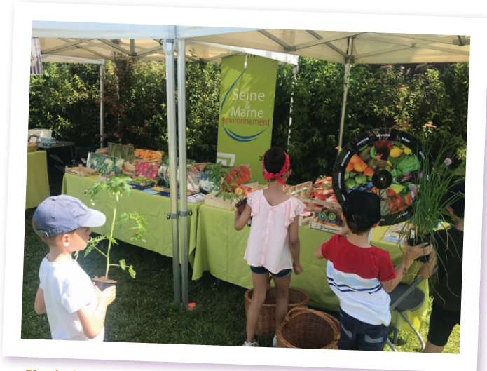
Fête des jardins à Montévrain - Juin 2019 (SEME)