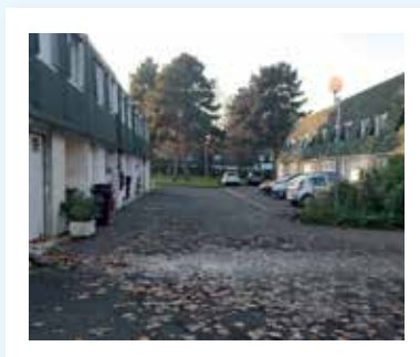
Bois de Malvoisine, Noisiel, novembre 2019 Étudiants POstCarbone

de 195 pavillons à Noisiel : après l'expérience de Pontault-Combault et en accord avec l' ASL 2 Bois de Malvoisine , la commune de Noisiel et la Communauté d'Agglomération Paris Vallée de la Marne , SEME a proposé aux habitants de les accompagner pour pallier aux fuites et déperditions thermiques importantes de leurs biens. Des étudiants en master PostCarbone de l' école d'architecture de Marne-la-Vallée ont en outre été missionnés pour réaliser une étude sur le quartier, honorant une commande de la DDT 3 et de la DRAC 4 , et permettant aux conseillers de Seine-et-Marne environnement , avec le soutien du CAUE77 et dans le cadre du POPAC 5 de la CAPVM , de poursuivre l'accompagnement du quartier à partir de ces travaux de recherche.