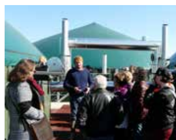
Visite du méthaniseur agricole de Saints Carrefours de la Biomasse – Mars 2019 (SEME)

Organisée en mars 2019 par SEME, la deuxième édition du salon " CARREFOURS DE LA BIOMASSE " a rassemblé les professionnels des filières biomasse agricole et bois et leurs partenaires institutionnels, avec pour objectif de valoriser les atouts environnementaux de la biomasse, tant en terme d'énergie que de matériaux de construction et de rénovation du bâti.