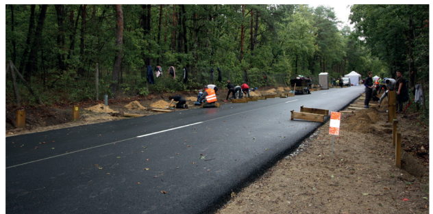
CRAPAUDUC - 2 OCTOBRE 2020 (SEME)

SEME y a greffé l'organisation du chantier participatif des entreprises adhérentes de l'UNICEM Ile-de-France. Par ailleurs, SEME a offert pour chacun des participants, un repas financé par l'UNICEM Ile-de-France, dans une démarche s'inscrivant dans le développement durable : un choix pour un menu végétarien ou non, de la vaisselle non jetable (procurée à la recyclerie locale et chez EMMAUS), et des aliments BIO 100% seine-et-marnais.