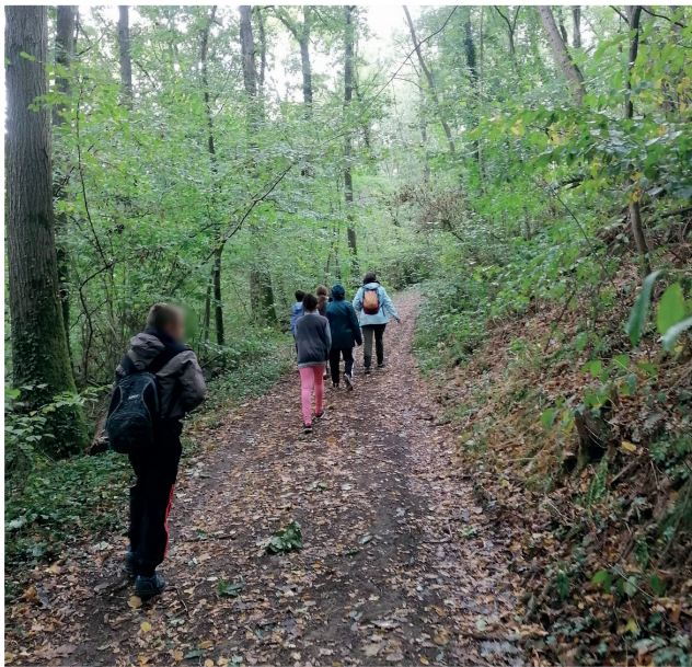
SORTIE NATURE - 2020 (SEME)