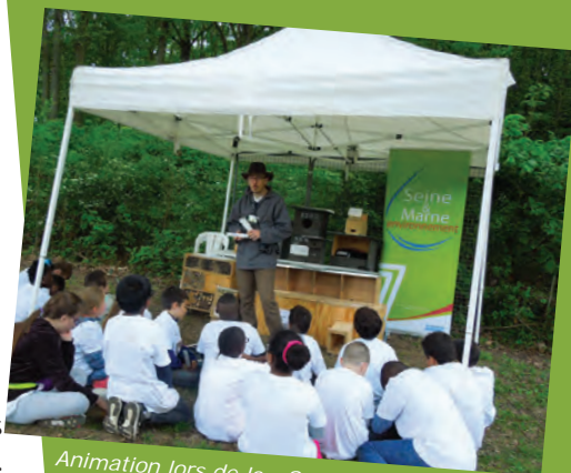
Animation lors de la « Semaine de l'éducation à la nature » de la FDC77

176 animations pour 2375 personnes (particuliers ou scolaires)