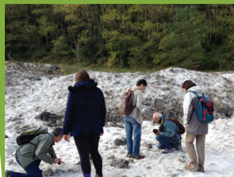
Sortie nature, Larchant