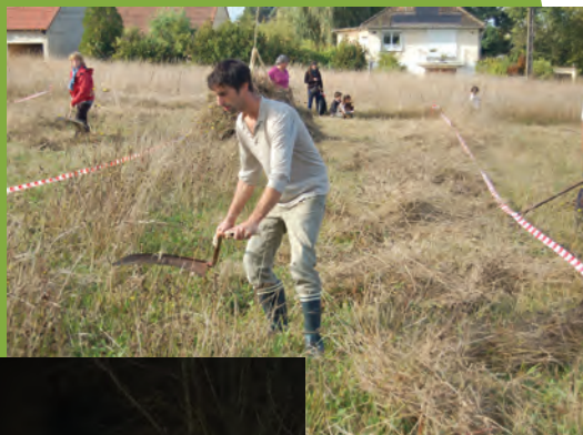
Chantier de fauche, Thoury-Ferrottes

** Syndicat Mixte pour l'Aménagement du Morbras