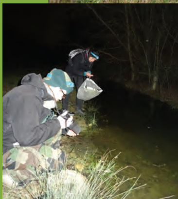
Inventaire amphibiens, SMAM**