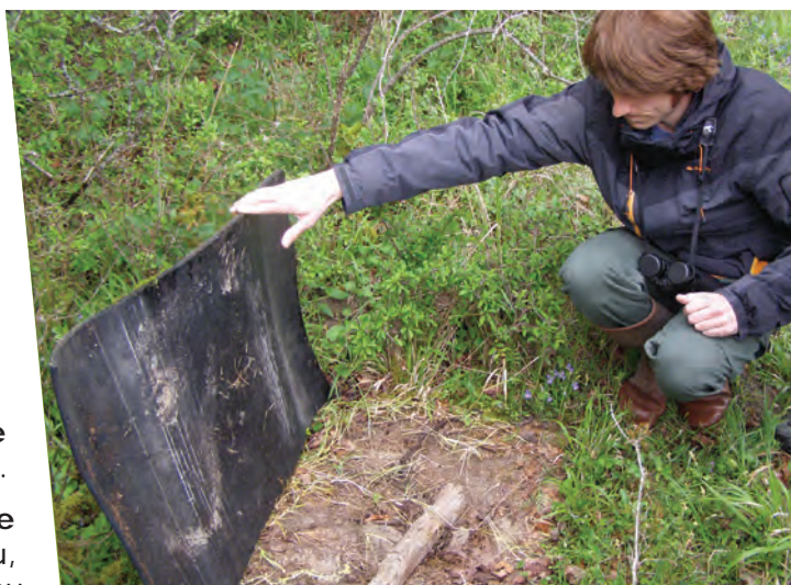
Formation reptiles, ENS de la plaine de Sorques, Montigny-sur-Loing

Retrouvez notre calendrier des animations sur notre site : www.seine-et-marne-environnement.fr