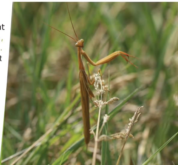
Mante religieuse (Mantis religiosa), inventaire insectes à Cesson - Crédit photo : Lucile Ferriot, SEME

Enfin la protection directe de la biodiversité est renforcée notamment par un alourdissement des sanctions liées aux atteintes contre les espèces protégées ou par la reconnaissance en droit français des réserves de biosphère.