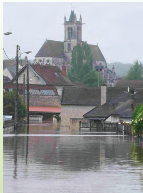
Crue du Loing, juin 2016

C'est donc une année riche en activité qui s'annonce à nous.